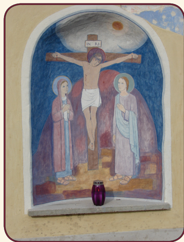
(Lojze Čemažar: Križani vaško znamenje v Sr. Gameljnah)

Z merili zgodovinske stroke vstajenja ni mogoče niti povsem zanikati niti povsem potrditi. Tako kot zgodovinar kot tudi kot človek lahko v pojave in dogodke, ki presegajo dožemanje v kategorijah tega sveta, predvsem verjame. In z istim dvomom kot v njih lahko verjame, lahko v njih tudi ne verjame. Morda zgodovinar zaradi svojega metodološkega pristopa težje verjame v čudeže, toda nenazadnje lahko lažje prizna, da je tudi vse naše življenje en sam čudež.