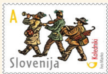
Znamka Pošte Slovenije z upodobljenim motivom kolednikov Maksima Gasparija